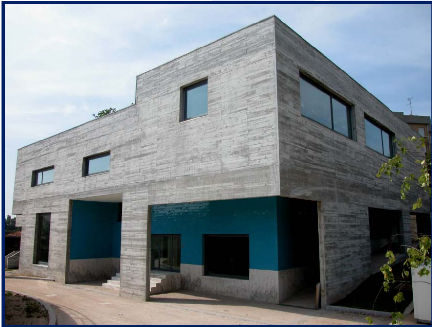
Instalações do IAREN em Matosinhos

Associação privada sem fins lucrativos de utilidade pública, auto-sustentável e independente